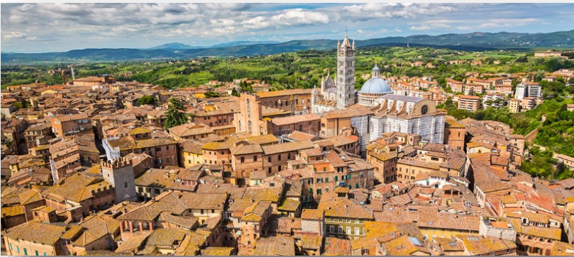
Cathédrale de Sienna (Duomo)