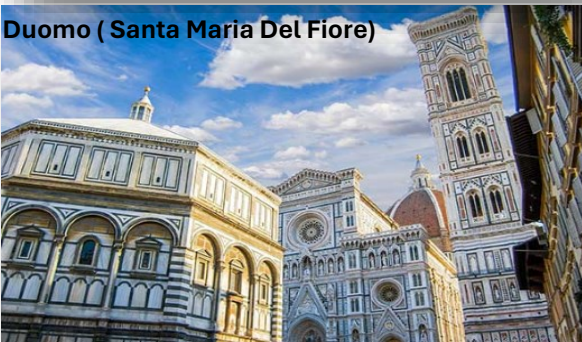
Duomo ( Santa Maria Del Fiore)

El centro histórico de Florenxia es un museo al aire libre, con probablemente la mayor concentración de obras maestras artísticas del mundo.