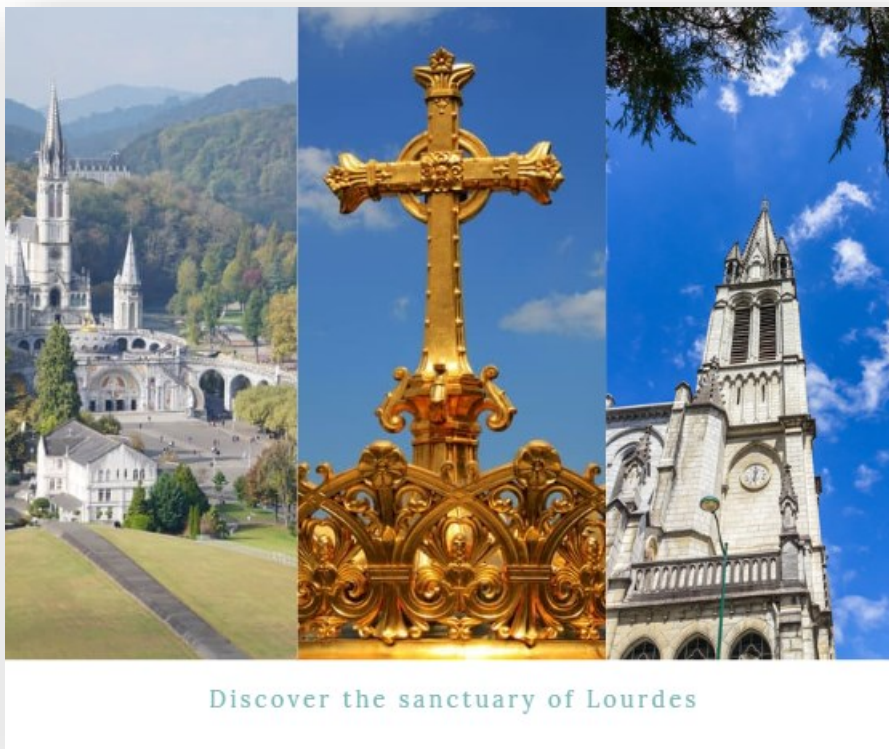
Discover the sanctuary of Lourdes